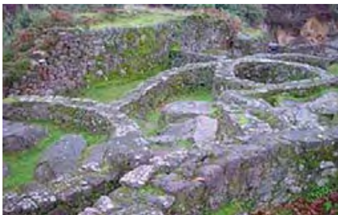
F. 14 Castro de Troña, Pías, Pontearreas,

consistente en señalizaciones, centros de interpretación, áreas de descanso con bancos, mesas y fogones; a su alero, y reforzándose complementariamente, se ha desarrollado y consolidado asimismo toda una oferta hostelera consistente en casas de labranza rediseñadas hacia el turismo rural, hostales, restaurantes y asadores. Para todo ello, las administraciones y las comunidades parroquiales de montes han intervenido acotando determinadas cimas, roquedales y espacios forestales de significación congregativa tradicional para preservarlos definitivamente de la marejada extractiva y de caóticas iniciativas urbanísticas (así ocurre, por ejemplo con el grandioso Faro de Budiño, con la Serra do Galíneiro; el Parque natural del Monte Aloya; Penedos de Cans o El Pianista, Alto da Forca, Alto de San Cibrán, castiello de Sobroso, Penedo dos Namorados, castro de Troña y otros lugares entre Porriño, Salceda de Caselas y Pontearreas )