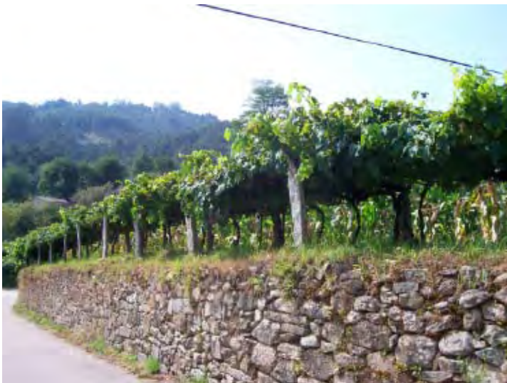
F. 2 Viñas y maíz sobre socalco, Guláns.

Los principales caracteres del labradío –los viñedos y el policultivo con predominio de maíz y patata– responden a diferentes desarrollos históricos. Desde el bajo medioevo, y consolidándose la tendencia en los siglos posteriores, foros, diezmos y rentas señoriales se imponen preferentemente en cabazos, bocois y pipas de vino, además de cereales, recen-tales y carros de leña. La rentable y segura colocación del vino en los mercados urbanos a través de cosecheros y bodegueros siguió alentando el cultivo de los emparrados durante el s. XX, hasta la actualidad, pero no la posición dominante de las llamadas casas fortes de