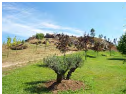
Fs. 15 y 16 “Parque recreativo y forestal do Espicho do Faro”, Entienza.