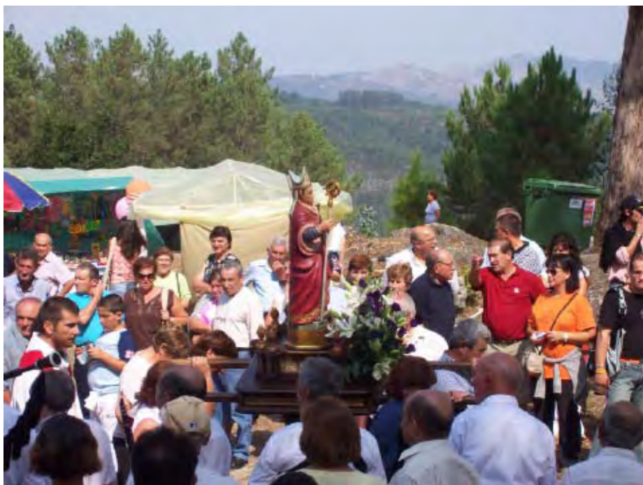
F. 13 San Cibrán, Guláns, Pontearreas.

En cualquiera de los dos casos, estas narrativas de hermanamientos contribuyen a generar el sentido de una formidable sacralización del cosmos socioterritorial: los santos –en movimiento antagónico respecto a los mouros ctónicos que en ellos radicaron– ascienden a los montes, y con su presencia en santuarios sacralizan las alturas, y desde ellas a todo el