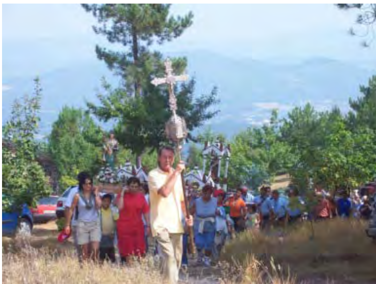
F. 19 Síntesis de comitivas parroquiales en el monte.

Pero ante todo, la inversión de la estructura del paisaje transforma los cronotopos del remoto illo tempore en loci de acronotopía: los roquedales, capillas, cotos arbolados experimentan al ser poblados un año tras otro por la entusiástica y activa presencia multitudinaria de la humanidad local un solapamiento de tiempos que deviene en una temporalidad única y sin límites; que anula o remite a un segundo plano de menor significación el fluir de la historia, los contrastes entre humanidades, épocas y generaciones.