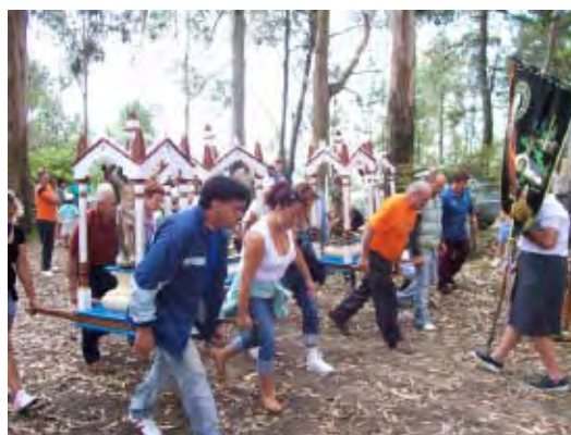
F. 18 “Venias” de Picoña y Guláns, San Cibrán.