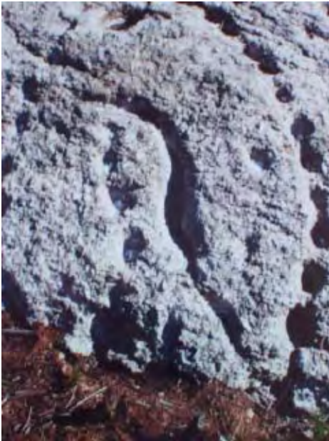
F. 8 Petroglifo con sinusoides, Entienza.

Dicían os vellos que, antes, os mouros facían uns nós cunha corda. Estes nós significaban unhas palabras que facían que a corda se convertira nunca cobra grande; e a cobra gardaba o tesouro que estaba no Penedo dos Mouros. [...] Un día, un cazador que andaba a cazar por eses sitios ouviu un dulce canto. Entón, achegouse para alá, e mirou enriba do penedo unha criatura que era metade cobra e metade muller. Coma a parte de muller era moi goapa, o cazador namorouse dela; e ela contoulle que saía sempre ás doce do día e ás doce da noite, e que se quería casar con ela, tiña que matare a metade da cobra, para desfacelo encanto. E logo, o cazador marchou... Volveu á hora que ela tiña que sair, e matouna. E de seguido, desfixouse o encanto, e a grande cobra convirtíouse nunha muller moi fermosa coa que casou o cazador. Despois o encanto, cando quedou desfeito, marchou pró fondo do mar. E moitos din que nise momento foi cando rachou o penedo [El Penedo dos Mouros era una gran roca agrietada, hasta que fue explotada por los canteros en la década de los 50].