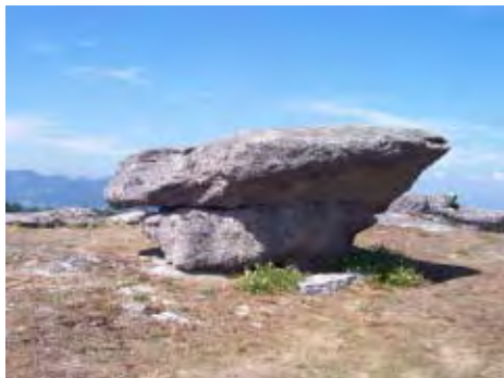
F. 5 Silla do Rei mouro, Faro de Entienza.

cadras en lo alto de penedos montesinos; a veces petroglifos) y bebedeiros que utilizaban para recoger el agua y beber, además de bodegas , mesas , etc, que se identifican señalando ciertas formaciones rocosas. De este modo, estos colectivos personajes eran imaginados abocados a los mismos menesteres y recursos de la cotidianeidad que la humanidad actual. Pero la narrativa a ellos dedicada introduce ambivalencia. No sólo es ya que su humanidad se represente simultáneamente revestida de unos rasgos de marcada alteridad, como el carácter montaraz e incluso el troglodítico –en Entienza se dice que eles vivían na Cova dos mouros, e era alí onde entraban ás rastras cando tiñan que protexerse –; son considerados los antiguos pobladores del mismo territorio, pero no los antepasados: además, tiende a distanciarles, pues si les dota de estructuras sociales, necesidades y preocupaciones como la humanidad actual, lo hace en registro épico: en las alturas montaraces en las que invariablemente se les hace habitar, se encuentra la silla do rei mouro ; presunto escaño bajo una laja situada en lo alto del Faro de Entienza, considerado trono desde el que el remoto monarca otearía sus posesiones.