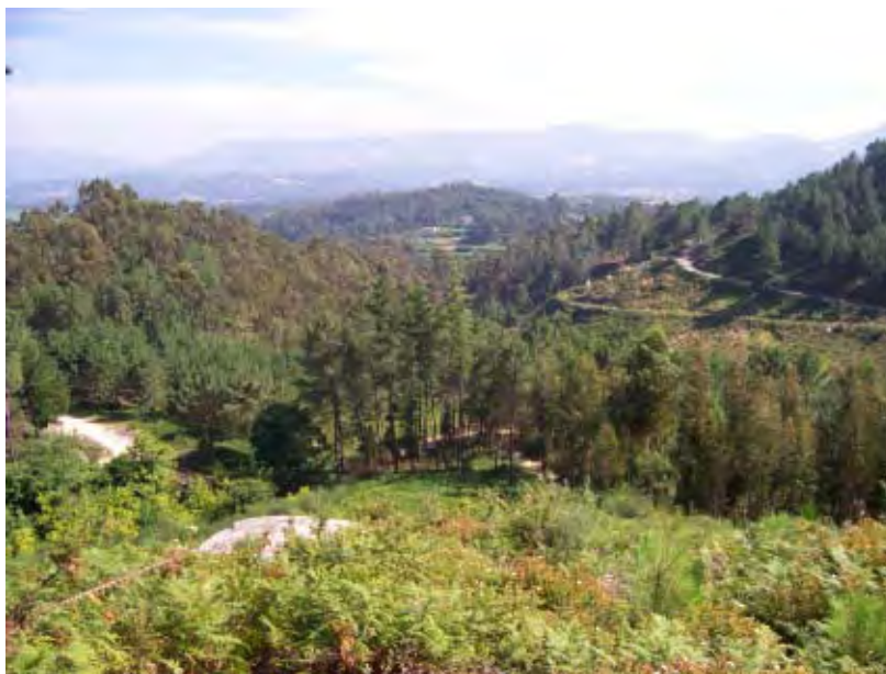
F. 1. Monte de Entienza. Rego da Fraga. Al fondo, el Miño y Portugal.

cosmológicas. Me refiero a o monte , y su mitología de roquedales y moradores, sus utilidades económico-laborales, límites y emplazamientos celebrativo-rituales. Un macroelemento paisajístico que viene desempeñando un papel capital en el edificio simbólico-efectivo de la cosmovisión y cosmopraxis aldeanas, y que quizá hasta ahora ha recibido poca atención expresa desde el ángulo de la antropología, eclipsado en buena medida por la fascinada atención que absorben los procesos y tramas socioculturales emplazadas “ahí abajo”, en el humanizado y cultivado marco de la aldea, la parroquia y sus barríos o lugares acasados constelados entre las tierras agrícolas de veigas , viñas, camiños y prados.