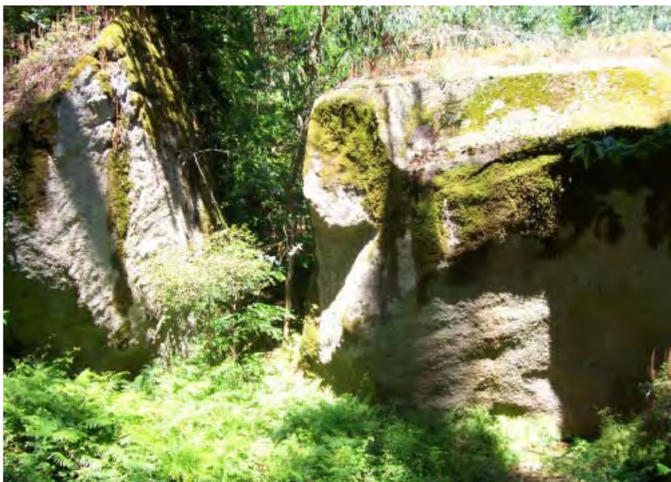
F. 7 Poza da Fraga, Entienza, Penedos dos mouros.

Yo me acuerdo que cuando éramos pequeños y llevábamos las ovejas a pastar, nos decían los vellos que allí, en la Poza da Fraga... hay dos penedos... uno redondo y grande que está encima del rego... pues decían que están huecos... Y decían que allí dentro hay mouros... o fantasmas o algo así. Y nosotros poníamos la oreja para escuchar, encima de los penedos... y se oían ruidos. Por debajo pasa el agua, e a lo mejor el ruido es del agua; pero teníamos miedo y escapábamos de allí. A lo mejor nos contaban eso para que no nos acercáramos.