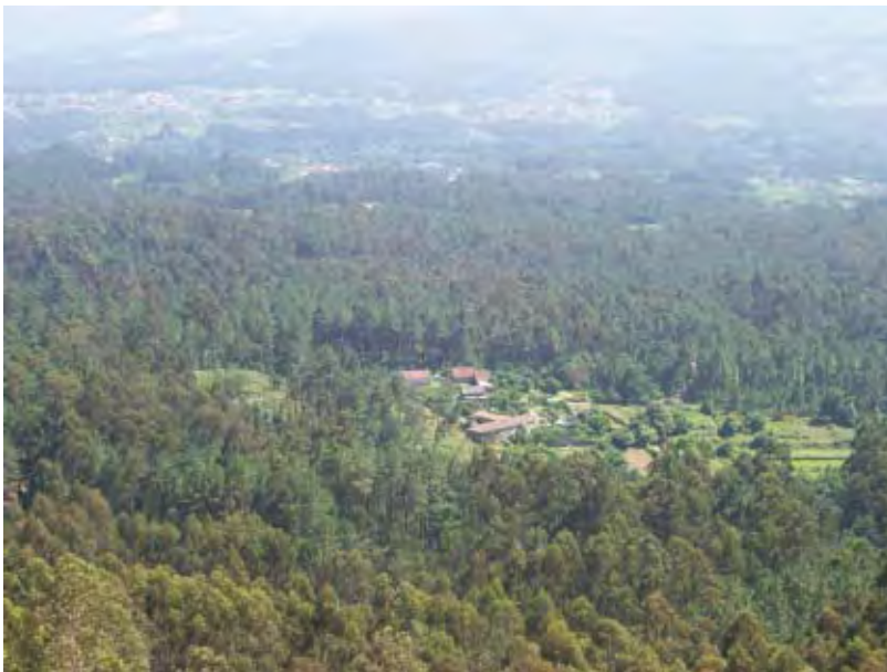
F. 3 Monte da Lóbrega y lugar de Donello, Entienza. Al fondo, Portugal.

El monte proporcionaba, y proporciona hoy en día a las comunidades de montes parroquiales, en fin, granito que vender a los canteiros a tanto alzado por metro cúbico, o madera de pino o eucalipto que vender por toradas a los cortadores de la comarca: ingresos que han permitido sufragar gran parte del asfaltado de la red viaria, acometer las traidas de aguas , el saneamiento de los asentamientos, la construcción de centros vecinales, pabellones y pistas deportivas. En fin: buena parte de las empresas de infraestructura en las que se ha imaginado y concretado la idea de progreso a lo largo de las últimas décadas.