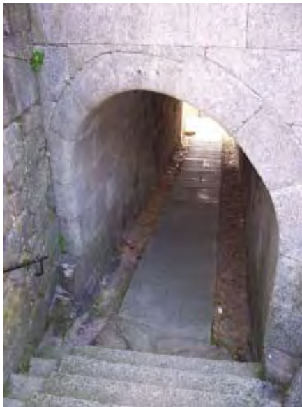
F. 11 Túnel bajo el convento de las Clarisas, Tuy.