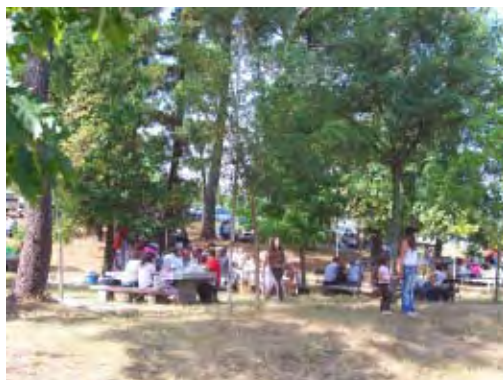
F. 21 Comensalidad romera.

Por eso propuse al principio que sondeando, mediante participaciones ritualizadas, las posibilidades de “ser” más allá de los límites internos y externos de las clasificaciones y esquemas axiológicos establecidos, los aldeanos logran imaginar desde la vívida experiencia de lo sensorial –es decir, de la plena inmersión corporal participativa– el sorprendente relieve multidimensional y las formas inusitadas y a menudo paradójicas que pueden alcanzar la identidad y los valores, poniendo de manifiesto incluso los ángulos ocultos, externos o potenciales de los mismos.