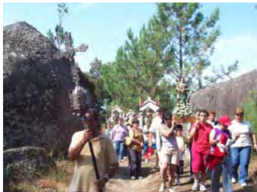
F. 20 Santos, penedos y comunidades.