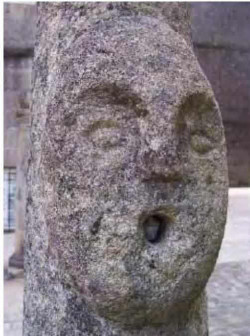
F. 4 Rostro esculpido, Tuy.

De los mouros o antigos se habla cuando se hace referencia a as cousas vellas del aquí aldeano, ofreciendo descripciones representativas del remoto pasado del territorio casi invariablemente circunscritas al de la parroquia del hablante –luego la memoria de las narrativas, así como las representaciones del illo tempore que las mismas comunican, se encuentran también sustancialmente troqueladas por ese insuperable ámbito socio-identitario y moral que es la feligresía–. De ellos se dice que fabricaron y usaron pías (buitreras intercomuni-