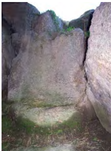
F. 6 Espicho do Faro, Entienza.

Por ende, las inquietudes imputadas a las de estos personajes son de superior magnitud; guerreras y defensivas... heroicas, podemos decir. Así, de los mouros se decía en la parroquia de Entienza –señalando el anciano hablante a lo alto del monte Faro, que cierra el Poniente de la feligresía– que