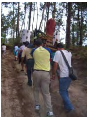
F. 17 Ascenso romero, San Cibrán.