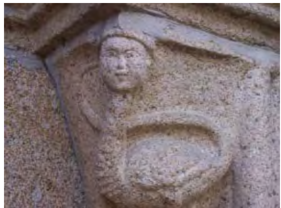
F. 9 Capitel. Mujer culebra.