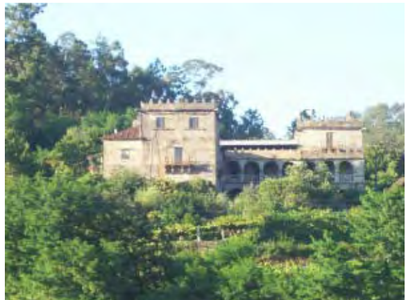
F. 12 Pazo de Picoña, Salceda de Caselas.

Pero las tradiciones orales referidas al paisaje montesino no se agotan en los mouros , túneles y sus prodigios: con tanta o mayor profusión se transmitían relatos acerca de los santos y santas cuyas capillas se alzan en las elevaciones, y que han venido siendo unos focos de ascensión y celebración romera. Estos relatos añaden un matiz de sacralidad hierática a las elevaciones orográficas cuyo sentido, si por una parte se contraponen diametralmente al simbolismo de caos, híbrida indefinición y taumaturgia negativa de mouros y encantos , por otra parte comparte con el mismo su ubicación en la esfera de lo numinoso, lo místico, prodigioso... y crucial para la humanidad. El carácter sobrehumano de los santos queda puesto de manifiesto en los episodios de apariciones y desapariciones, enfermedades y curaciones prodigiosas que les atribuyen los relatos, corroborando así sus atributos de abogados mediadores frente a los trances y miserias de los mortales.