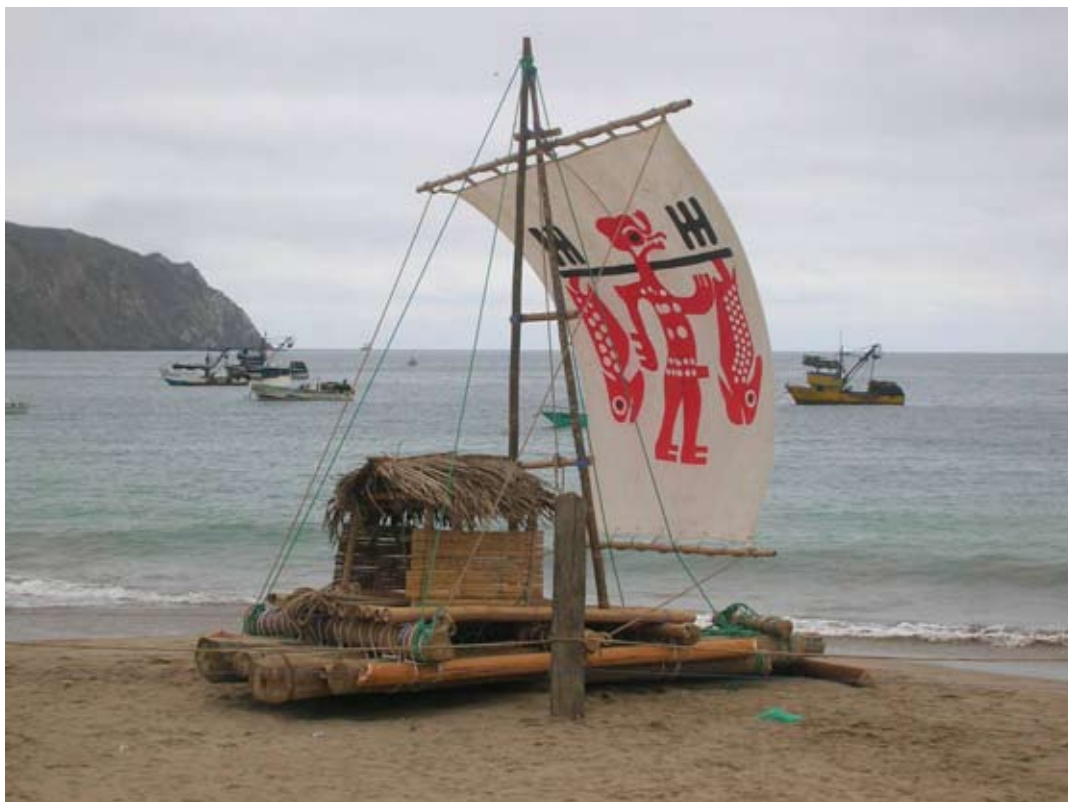
Figura 2: La Balsa Manteña, 2006.

y ciudades lejanas como Guayaquil y Quito llegan para la celebración cultural más importante del pueblo Salango (Figura 3). La gente se reúne para la botadura de la balsa. Requiere docenas de personas para mover la balsa inmensa. Poco a poco la gente, participantes y visitantes, empiezan a empujar la balsa que pesa más que dos toneladas. Cuando la proa de la balsa entra al mar los participantes y algunas visitantes que desean se embarcan a la balsa y atan un cabo a un barco pesquero para alar la balsa hacia el interior del mar. La balsa pasa por la bahía y a su destino. La Isla Salango es el destino y es la característica más prominente de Salango (Figura 4). La isla está localizada aproximadamente a dos kilómetros de la costa de Salango y muchos Salangueros creen que la isla tenía una importancia para las culturas antiguas de la zona y el ambiente natural mantiene una importancia para la población contemporánea. Corr (2003) sugiere que la geografía y lugares sagrados son aspectos importantes para las celebraciones rituales y la vida espiritual de los grupos quien actualizan las celebraciones. La geografía local y su entendimiento local informan el patrimonio cultural de la comunidad e impactan las experiencias de la vida actual. Es decir que cuando la geografía es algo fundamental para la ceremonia, indica que la geografía es parte de la identidad de una comunidad. Según Gudeman (2001) la relación de una gente a la geografía informa la consciencia colectiva y la identidad.