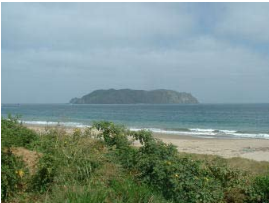
Figura 4: Isla Salango.

zaje. La construcción de la balsa y el paseo a la Isla Salango forman a base para afirmar su identidad y su conexión con la prehistoria de Salango.