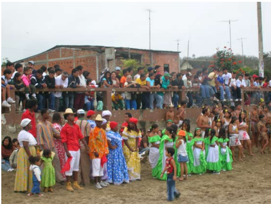
Figura 3: Visitantes, 2007.

poco más de una hora. Los participantes anuncian su regreso a la playa con el sonido de un Churo, una concha conocida científicamente como “ Strombus ,” y la presentación de conchas de Spondylus , unas de las conchas más importantes para la población precolombina de Salango. 5 El uso de las conchas en la realización del festival confirma la importancia de lo histórico para la población contemporánea de Salango y establece una conexión simbólica con el pasado. El retorno triunfal de la balsa marca la continuación de la identidad Manteña en su forma contemporánea aunque confirmando relaciones locales entre lugar y el ambiente natural.