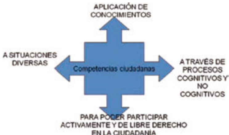
Ilustración 2: Utilidad y uso de la competencia. Elaboración propia.

tividades de aprendizaje colaborativo en ellas, desde una perspectiva del proceso formativo socio-constructivista.